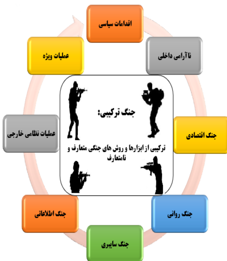
شکل ۲: روش جنگ هیبریدی از نظر کنفرانس امنیتی مونیخ

جنگ هیبریدی در گزارش سال ۲۰۱۷ کنفرانس امنیتی مونیخ (ایشینگر ۱ ، ۵۸-۵۲، ۲۰۱۰) توجه به عملیات روسیه در اوکراین در شکل ۵ تعریف شده است: